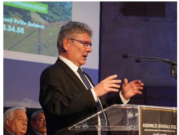
TABLE RONDE : L'EAU : UN ENJEU MAJEUR POUR NOS COLLECTIVITÉS