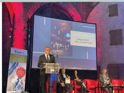
PHILLIPPE DELORT MAIRE DE SAINT FLOUR

En introduction, M. le Maire a rappelé l'honneur pour la Ville de Saint-Flour, sous préfecture du Cantal, d'accueillir les élus en soulignant le partenariat avec l'AMF 15 pour l'organisation conjointe de cette édition.